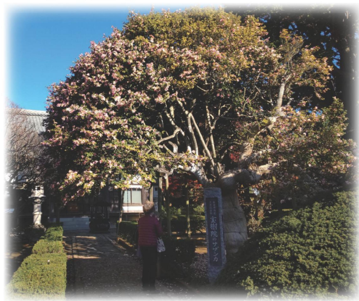
『宝樹院のサザンカ』

※佐倉市指定文化財（天然記念物）に指定された（令和2年3月23日）古木で、「興胤公お手植え」と伝えられている。